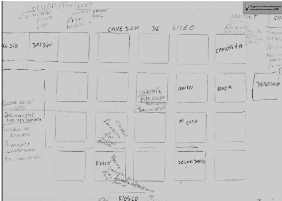
Imagen 1: "Circuitos/circulaciones de T" (33 años, 18/11/2015)