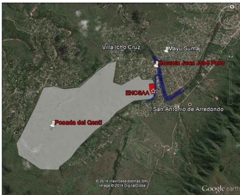
Imagen 1: Foto satelital intervenida- El terreno, propiedad de La Posada del Qenti

Este es el contexto directo en el que tiene lugar el Encuentro Cultural que analizamos en esta oportunidad. Acercemos más el ‘lente’ hacia San Antonio de Arredondo, para ubicar en su entorno inmediato el terreno donde año a año se realiza.