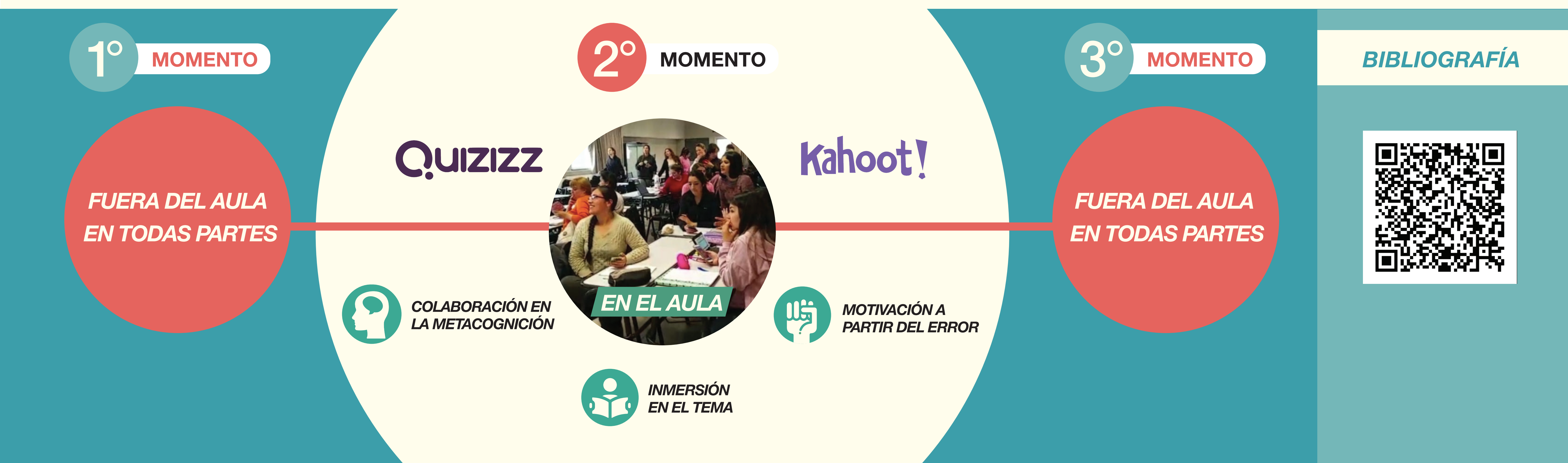
¿Para qué sirvieron, según su criterio, las actividades gamificadas? Primer Lugar

Analizar las valoraciones de los estudiantes respecto de los procesos gamificados e invertidos según características del aprendizaje.