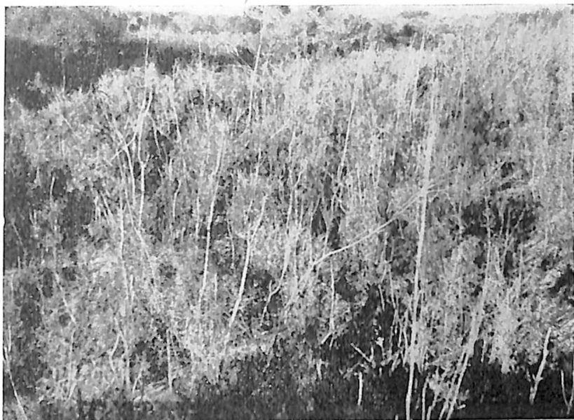
FIG. 4 - Almácigo natural que circunda el bosque

arroyo de la Estacada, Tunuyán. Igualmente, viajando con el citado profesor, observamos pequeñas plantas en las islas del río Mendoza, entre Cacheuta y Potrerillos, y en otra ocasión, al margen del camino a San Juan (Kilómetro 22).