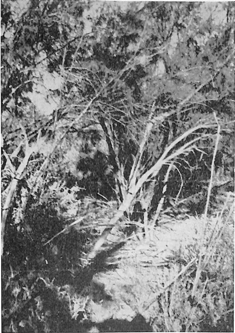
FIG. 3 - Otro aspecto del bosque

dice, en el Desaguadero, gran cantidad de plantitas salidas de semilla, en las playas del río, pero según parece mueren pronto o permanecen algún tiempo sin crecer. Además observó que muchos almácigos que recibieron agua en exceso, habían muerto. Vió producirse el mismo fenómeno en el