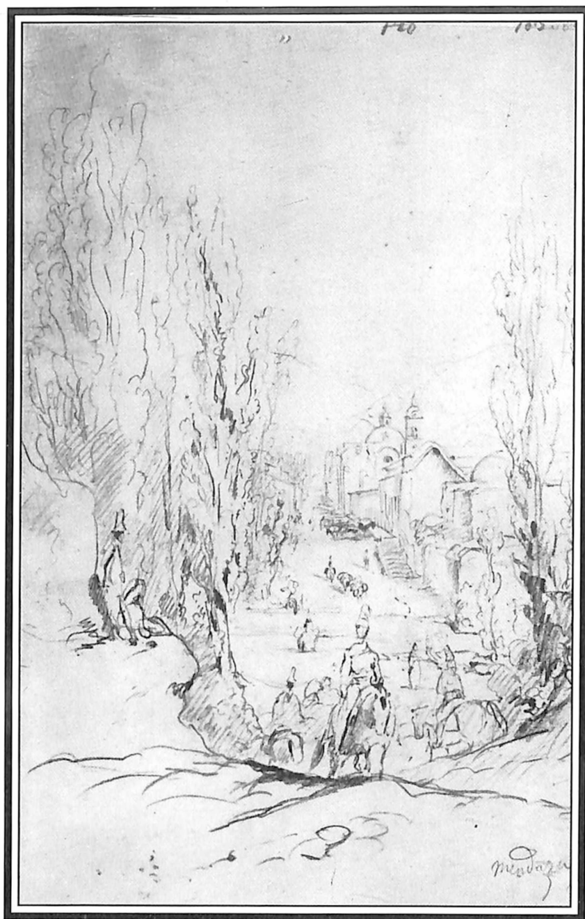
Juan Mauricio Rugendas. Calle en Mendoza . Dibujo.