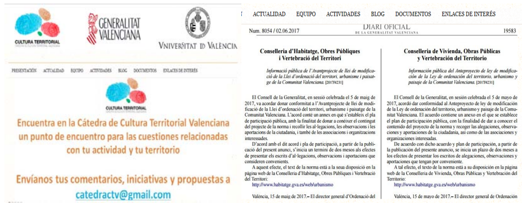
Fig. N° 2. Catedra de Cultura Territorial Valenciana

Es en este contexto, con este entendimiento y en un momento donde se abrió una ventana de oportunidad, con el entonces reciente cambio de gobierno autonómico y un interés por reforzar las relaciones entre Universidad y responsables de la Política Territorial del Gobierno Valenciano, que surgió en el año 2016 la Cátedra de Cultura Territorial Valenciana (CCTV).