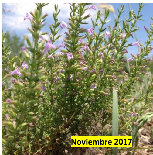
Figura 5. Estado de floración plena (Nov/2017)