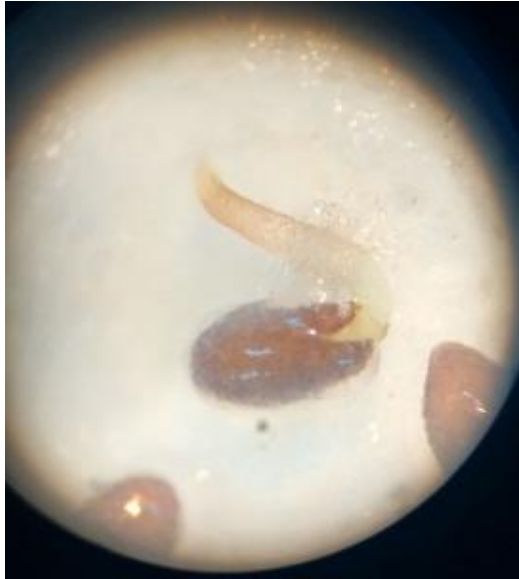
Figura 2. Microfotografía de semilla de H. Multiflora germinando sobre soporte húmedo en caja de Petri.

de incubación a las que fueron expuestas fueron 20°C y 12 hs de luz. Se consideró semilla germinada al aparecer la radícula (Figura2)