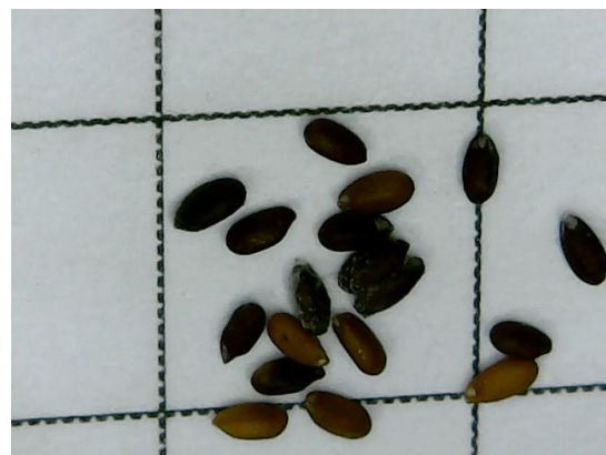
Figura 3. Semilla mostrando la diferencia de color del yuyero de Loma Bola

diferencia de medias mostraron diferencias significativas sólo para poder germinativo (PG). Los valores de PG en ningún grupo superaron el 40%. Esta especie esta reportada como portadora de dormición fisiológica y que necesita un período de reposo de 6 meses para superar la dormición (Fernández et al , 2006). Entonces esta podría ser la causa del abajo PG encontrado en estas muestras de reciente cosecha (Marzo del 2018). En dos de las muestras compradas a vendedores de la zona (“yuyeros” tradicionales) se observó la mezcla de semillas de diferente color (muestra cuyo origen declarado fue Sierras de San Martín y muestra de Loma Bola) (Figura 3). Se procedió entonces a la separación de las semillas por colores antes de la siembra para obtener PG, se las pesó y puso a germinar en idénticas condiciones que el resto.