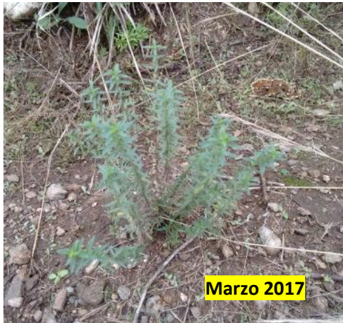
Figura 4. Estado Vegetativo (Mar/2017)