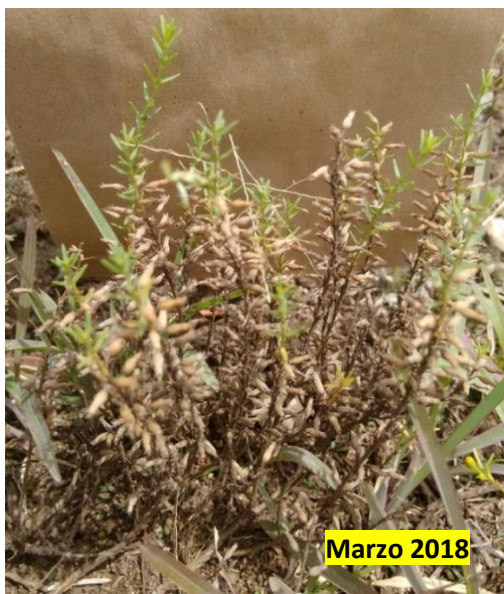
Figura 6. Estado de Fructificación