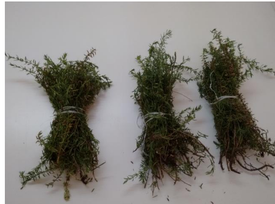
Figura 1. Manojos de H. Multiflora comprado a un "yuyero" de Las Chacras, de recolección reciente (feb/18)

Tanto las muestras recolectadas como aquellas compradas frescas fueron secadas en bolsas de papel durante algunas semanas, para lograr un material bien seco. Las semillas fueron separadas del resto de la planta en forma manual y mediante el empleo de cedazos de distinto diámetro se las limpió de restos extraños (tierra, y restos de hojas tallos y cáliz) para su posterior almacenamiento. La primera limpieza separó los restos de mayor tamaño. Luego se hizo una segunda limpieza usando una hoja de papel inclinada, por la cual se dejaba deslizar la semilla gracias a pequeños movimientos vibratorios. Las semillas se dejaron deslizar las semillas gracias a su esfericidad y a mayor tamaño que las impurezas.