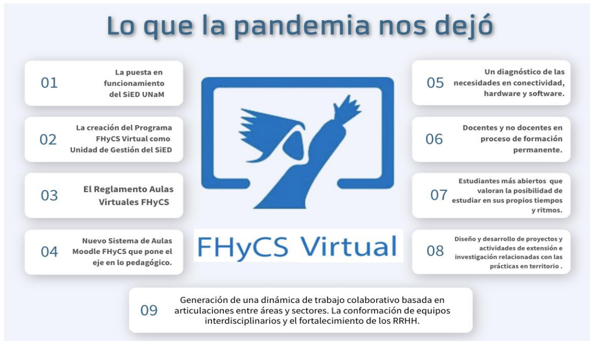
Gráfico 5. Lo que la pandemia nos dejó

Enumeramos algunos de estos hitos en el siguiente cuadro de síntesis: