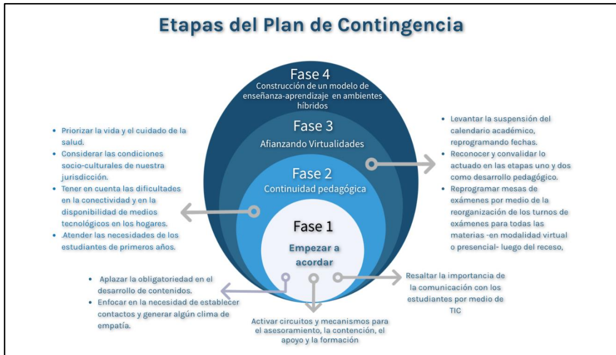
Gráfico 1. Etapas plan de contingencia 1

Cabe destacar que todos los claustros adecuaron sus roles y funciones a las nuevas condiciones y se tuvieron que tomar medidas de excepcionalidad que atendieran a las urgencias y contingencias en las diversas dimensiones de la vida institucional. Dado el carácter de estas Jornadas, haremos foco en las decisiones y acciones desplegadas para el acompañamiento pedagógico, las mediaciones TIC y la comprensión de las dinámicas propias de los EVEA.