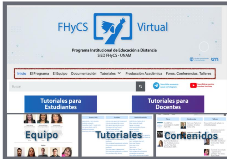
Gráfico 4. Sitio FHCS Virtual

A medida que avanzábamos en los aprendizajes para enseñar mejor capitalizando las posibilidades de las TIC, fuimos produciendo una gran cantidad de tutoriales, guías, respuestas a preguntas frecuentes, etcétera, acervo que fue alimentando un sitio en la plataforma de la facultad que nos acostumbramos a consultar.