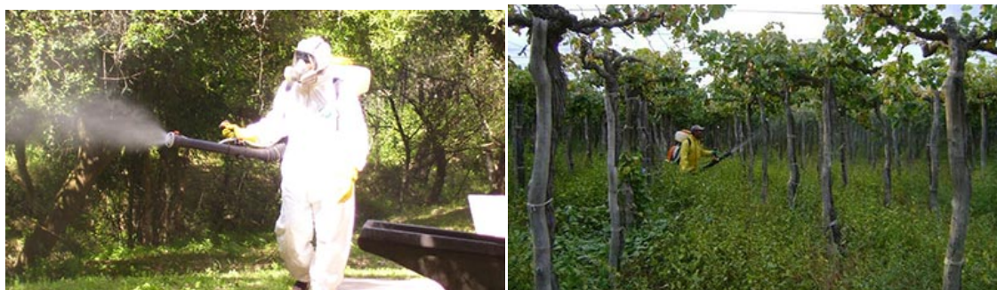
Mendoza, pionera en la regulación de agroquímicos

El presente trabajo expone un análisis de la ley 5665 de la Provincia de Mendoza “Régimen para Fabricación y Comercialización de Productos Agroquímicos”, sancionada en el año 1991. A través de esta son regulados todos los aspectos de trazabilidad de los productos, sustancias o dispositivos relacionados con agroquímicos. El análisis expone las principales fortalezas, debilidades, legislación relacionada y recomendaciones de la ley, que abran la puerta a su revisión.