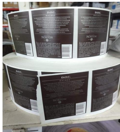
Imagen 5. Bobina de etiquetas de botellas de vino, lista para ser ingresada a la máquina etiquetadora.

Finalmente, llega el proceso de embotellamiento y etiquetado. Embotellar es concretamente, introducir el vino en una botella, generalmente de vidrio. Vale aclarar que existen otras maneras de envasar, como pueden ser el envasado de vinos en cajas tetra brik, bag in box, damajuana, etc. En nuestro trabajo de investigación, centramos nuestra atención en botellas de vino de vidrio, de 750 CC., con corcho tradicional.