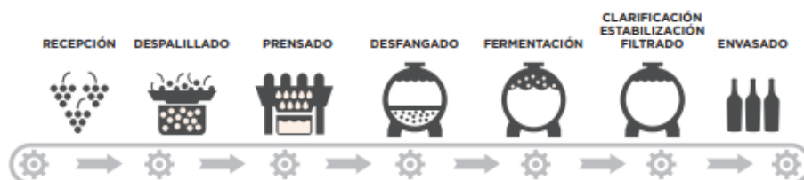
Imagen 3. Esquema del proceso de elaboración del vino blanco.

(1) respuestas a preguntas frecuentes sobre la Vitivinicultura Argentina, Corporación Vitivinícola Argentina, Observatorio Vitivinícola, Bolsa de Comercio de Mendoza. Disponible en: http://observatoriova.com/wp-content/uploads/2017/06/36-PREGUNTAS-BN-BAJA-modificado.pdf