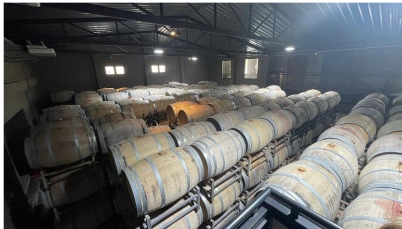
Imagen 4. Bodega Senetiner. Foto propia, tomada en visita guiada por proceso productivo del vino. Galpón que contiene 1200 barricas de roble. Noviembre 2021.

Finalmente, llega el proceso de embotellamiento y etiquetado. Embotellar es concretamente, introducir el vino en una botella, generalmente de vidrio. Vale aclarar que existen otras maneras de envasar, como pueden ser el envasado de vinos en cajas tetra brik, bag in box, damajuana, etc. En nuestro trabajo de investigación, centramos nuestra atención en botellas de vino de vidrio, de 750 CC., con corcho tradicional.