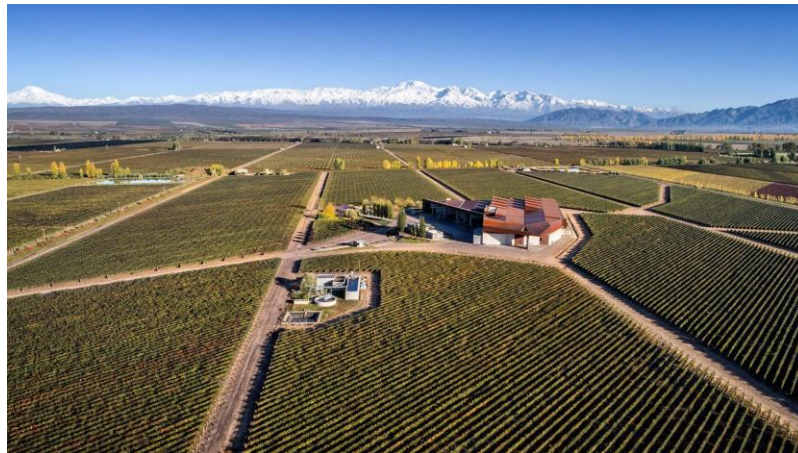
Imagen 1. Vista superior de bodega Navarro Correas.

2. Fase fermentativa. La uva prensada y su jugo (mosto) son llevados a vasijas de acero inoxidable (aunque pueden ser también de madera o cemento), donde, a través del trabajo de las levaduras, el azúcar de la pulpa se transforma en alcohol (fermentación) y otros productos secundarios. La fermentación es un proceso que lleva entre 4 a 10 días, aproximadamente.