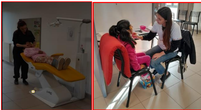
Pasantes trabajando en el Servicio