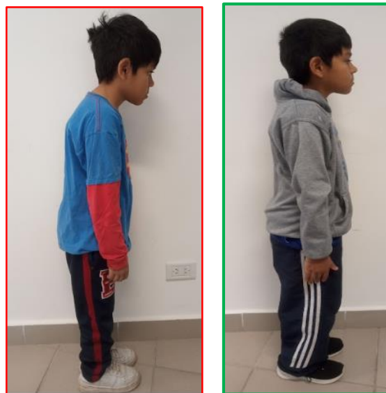
Eval. postural inicial

En cuanto a los resultados de los procesos de intervención podemos afirmar que son alentadores tomando en consideración la evolución que evidencian los niños atendidos.