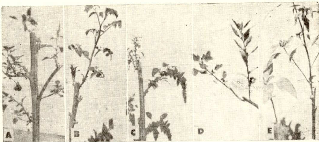
A: Amaranthus gracilis sobre Quenopodium albus ; B: Lycopersicum sculentum sobre Nicotiana glauca ; C: Quenopodium muralis sobre Amaranthus hibridus ; D: Quenopodium sambrosoides sobre Quenopodium albus ; E: Xanthium spinosum sobre Helianthus annus