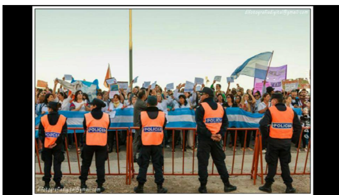
Foto2 Concentración MAR