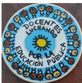
Figura 3. Muy usada.

Otras figuras usadas en menor medida y por algunos integrantes según sus filiaciones a los grupos.