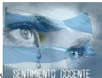
Foto cambio de perfil más utilizada post-conflicto.