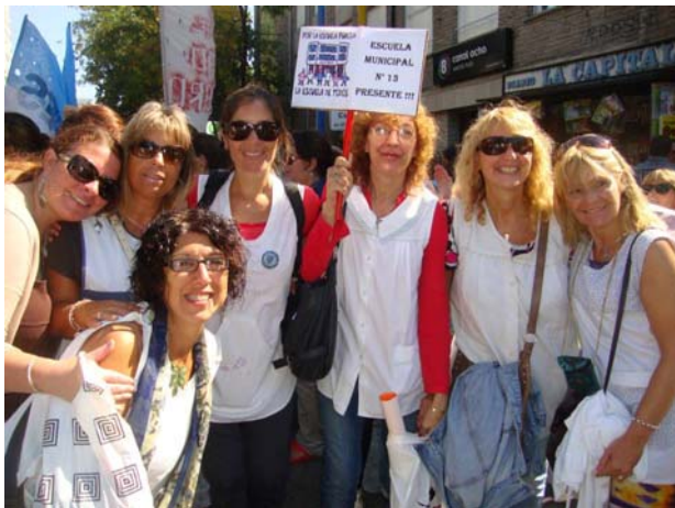
Foto 5. Otro grupo de docentes municipales.