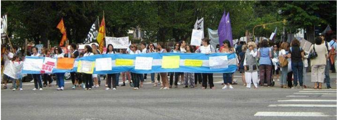
Foto 2. Con el paso de los días, la convocatoria fue creciendo y los docentes decidieron cortar la avenida principal, solo cuando el semáforo se los permitía, para no entorpecer el tránsito. La consigna fue: “Un bocinazo por la educación”

adhesión de los automovilistas que circulaban por el centro marplatense. La consigna fue: “Un bocinazo por la educación”.