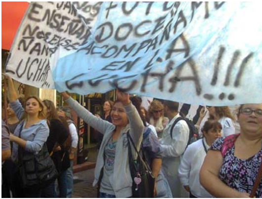
Foto 3. En la tercera semana del conflicto, los docentes cambiaron su estrategia y decidieron marchar por las calles céntricas de Mar del Plata.