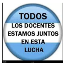
Figura 1. Muy usada.

Las figuras elegidas fueron las siguientes.