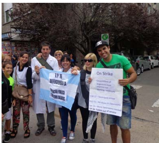
Foto 1. Docentes protestando frente al Municipio de General Pueyrredon. Participa también el profesor de inglés con su cartel.

Si bien los primeros encuentros contaban con pocos docentes, las acciones durante estos primeros días solo se remitían a conocerse entre docentes, comentar entre ellos como se desarrollaba el conflicto, cuáles eran las novedades, también prepararon la acción para ampliar la convocatoria, difundir la medida, preparar las primeras marchas y hacer conocer al resto de los docentes las acciones. La mayoría de estos encuentros fueron fotografiados y luego subidos a la red para lograr mayor convocatoria. Las concentraciones se realizaban a las 11 horas y duraban aproximadamente una hora.