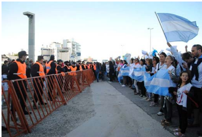
Foto1 Concentración MAR

El espacio de construcción virtual de la protesta también se convirtió en una disputa del control del mensaje, no solo se utilizaron las redes sociales, sino que las filmaciones que posteriormente fueron editadas y subidas a YouTube.