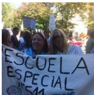
Figura 8. De confección propia usada por las docentes de esa institución.