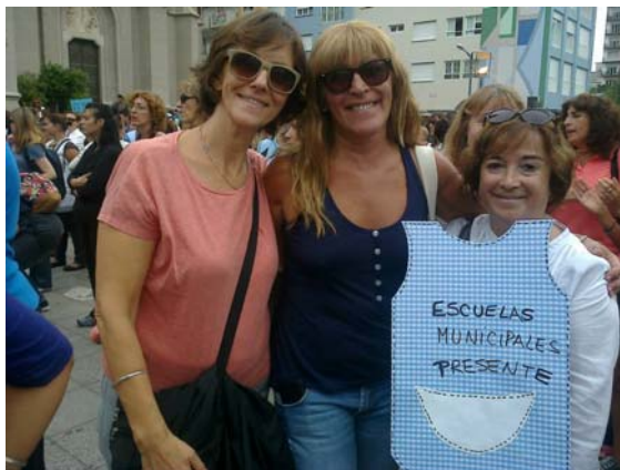
Foto 4. Docentes municipales que se suman al paro, más allá de no tener el apoyo del sindicato que los nuclea.