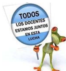
Figura 2. Variación de la figura 1