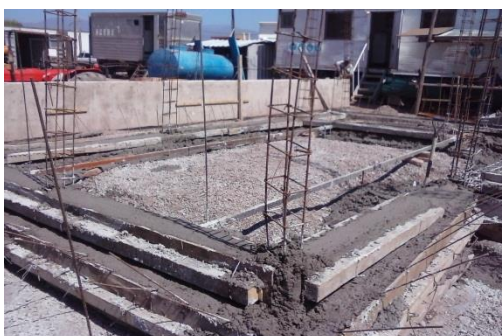
Imagen 26: Llenado de fundaciones