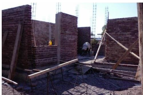
Imagen 27: Avance de obra. Construcción de muros