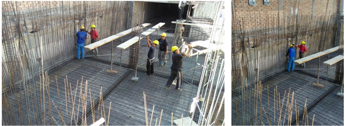
Imagen 8: Armado de losa maciza, primer subsuelo