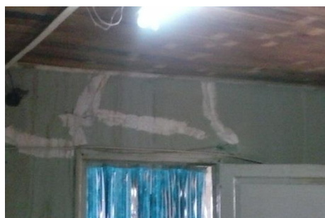
Imagen 3: Fisuras verticales a nivel techo y daño de humedad. Fisuras en dintel.

En la imagen 3 derecha, se observan fisuras en la viga de dintel. Como producto de las deformaciones, la puerta no cerraba correctamente.