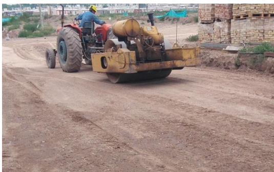
Imagen 22 Equipo de compactación