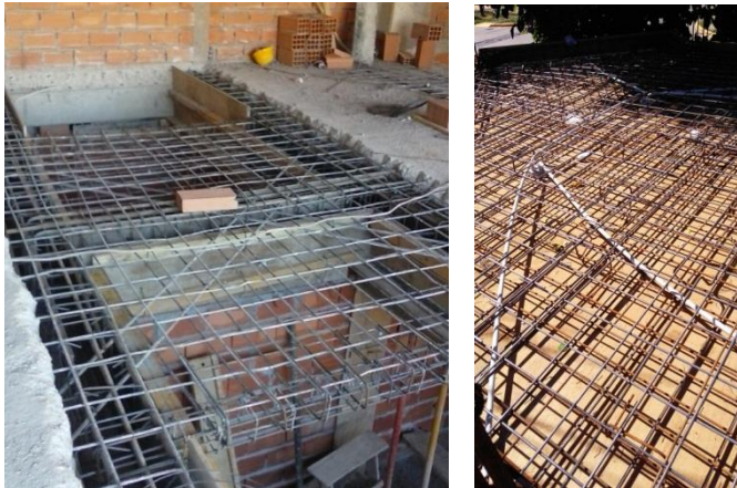
Imagen 18: Losa en H, reforzada con armadura diagonal (izquierda). Losa maciza (derecha)

Un aspecto interesante, fue la posibilidad de observar la ampliación de una vivienda, en la cual se utilizó un anclaje químico con epoxi, para vincular la construcción existente a la nueva. En la imagen 19 aprecia el entramado de vigas de la ampliación y el la imagen 20 se observan los detalles mencionados.