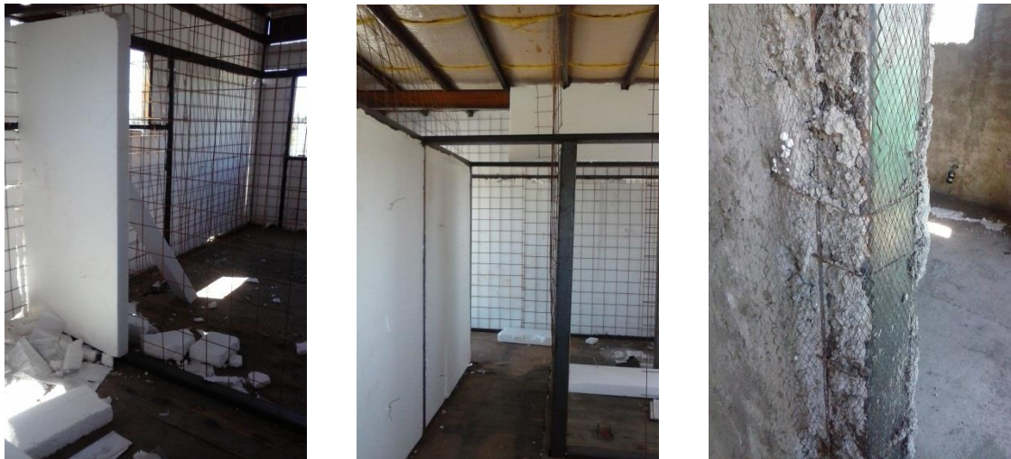
Imagen 32: Detalles internos.