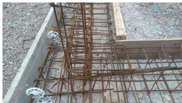
Imagen 25: Detalle de zapata.