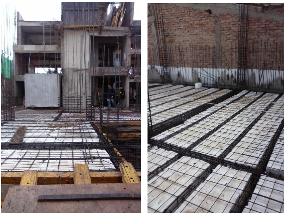
Imagen 11: Armado de vigas y losa nervurada de planta baja