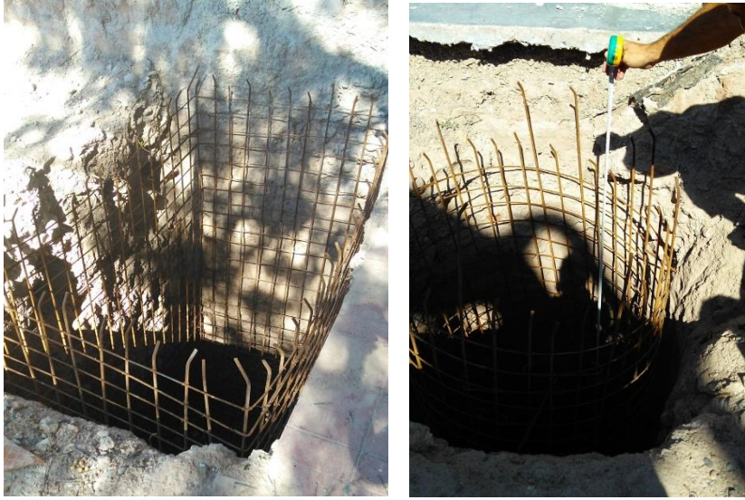
Imagen 17: Pozo de fundación. Medición de profundidad.