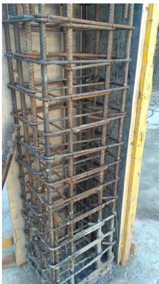
Imagen 10: Columna a inspeccionar para autorizar el llenado.