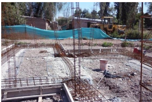
Imagen 24: Fundación de vivienda. Zapata corrida