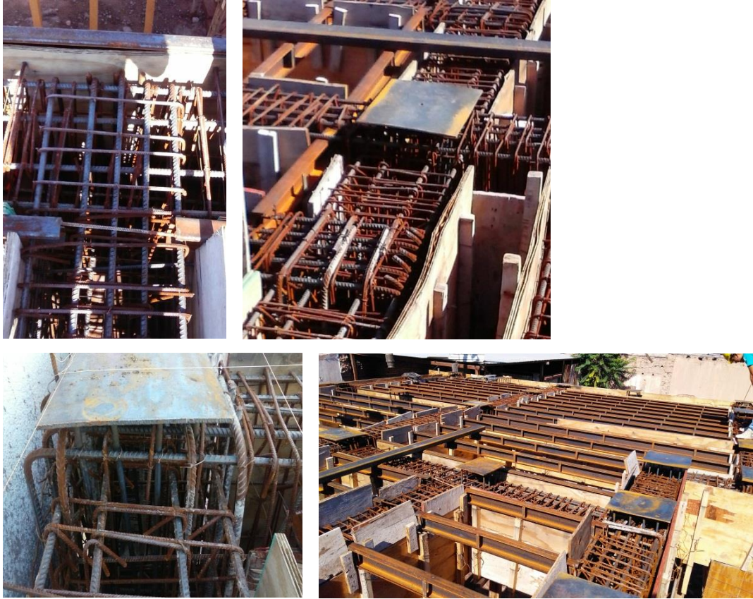
Imagen 15: Detalles de nudo y anclaje para columna metálica