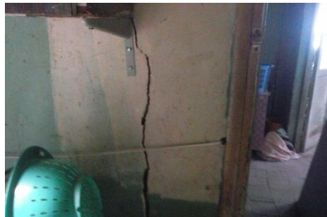
Imagen 2: Fisura pasante en muro de división interno