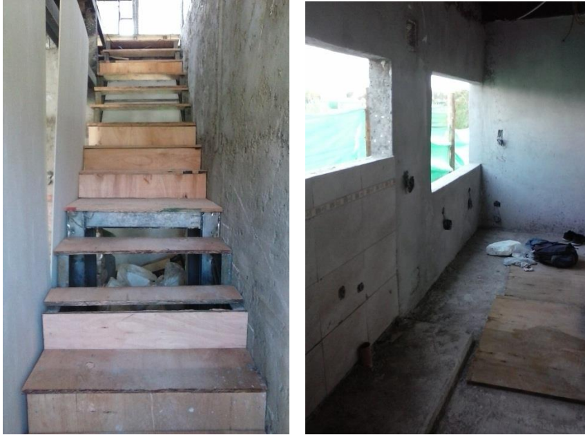
Imagen 33: Escalera y terminaciones de cocina