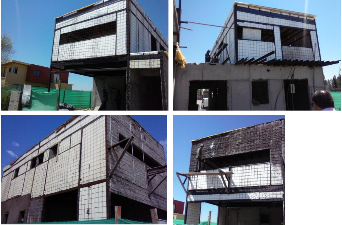
Imagen 31: Fachada, lateral y fondo de casa.