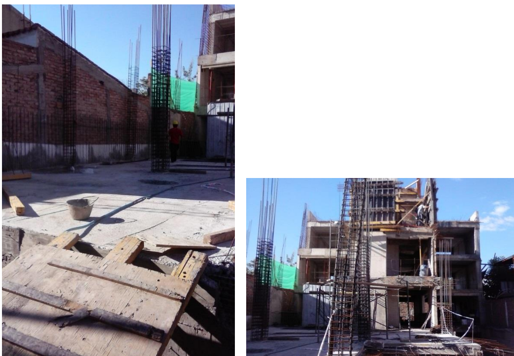
Imagen 12: Losa de planta baja y arranque de columnas. Cuerpo posterior.

Se pudo observar también el llenado de una losa maciza correspondiente al cuerpo posterior del edificio, el cual se puede ver en la imagen 12 a la derecha. En la imagen 13 se puede apreciar lo mencionado.