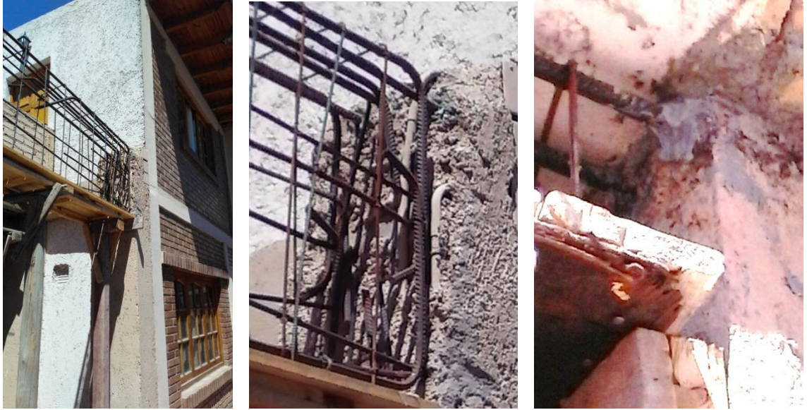
Imagen 20. Detalle de anclaje químico

Para finalizar, se realizaron inspecciones en un barrio del IPV, ubicado al sur del Barrio San Vicente. En estas inspecciones se pudieron apreciar tareas de compactación y movimiento de suelos.