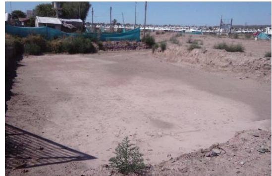
Imagen 21: Suelo estabilizado para relleno (izquierda). Terreno compactado (derecha)