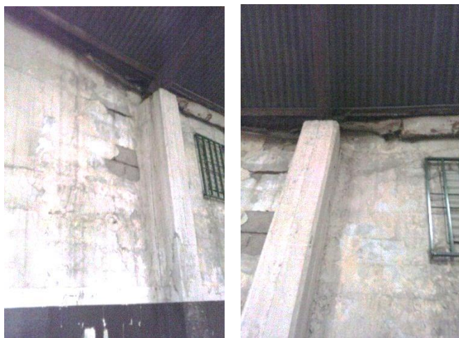
Imagen 5: Daños por humedad en muro sudeste

En la imagen 5, se puede ver el daño producido por la humedad, y en la imagen 6 se observa la deformación en el arco de techo producto del arrastre del muro al perder la verticalidad.