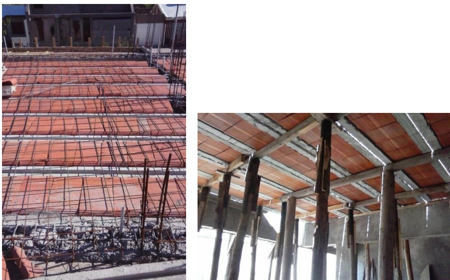
Imagen 14: Losa cerámica y apuntalamiento.

Entre otras inspecciones realizadas, se encuentran en su mayoría obras menores, más precisamente viviendas y locales comerciales, en las cuales lo más inspeccionado fueron losas y bases. En las siguientes imágenes se puede observar algunos casos de lo inspeccionado.