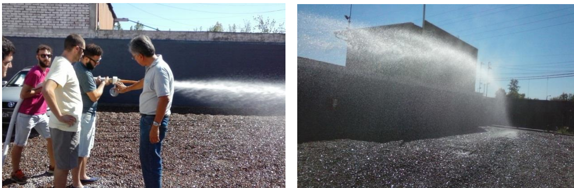
Imagen 30: Prueba de presión hidráulica

Esta inspección también abarcó el correcto funcionamiento de las bombas en el caso de que una de ellas deje de funcionar. Para ello se apagó de forma manual una de ellas y se calibró el sistema para que la presión no decaiga más de los límites antes de que el sistema ordene el arranque de la otra bomba.