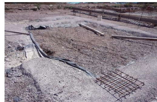
Imagen 23: Protección hidrófuga de vivienda