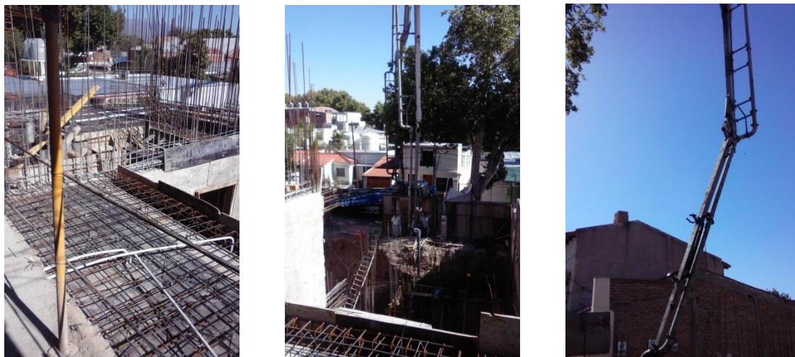
Imagen 13: Llenado de losa de techo