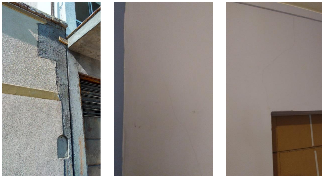
Imagen 4: Construcción nueva y afectada. Fisuras producidas por asentamiento de las bases.