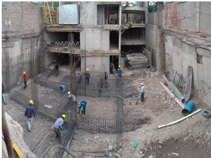
Imagen 7: Fundaciones

En esta obra, como particularidad, se pudo observar el armado de una losa nervurada. A continuación, se presentan imágenes ordenadas de forma cronológica a los efectos de visualizar el avance de obra.