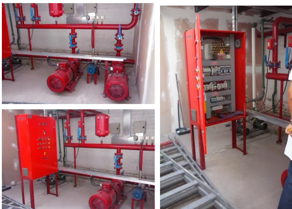
Imagen 29: Sistema de bombas y tablero de control.

La primera inspección correspondió a un edificio moderno, donde funcionan las oficinas de la empresa Eventbrite. Allí, se verificó que se encuentren colocados todos los elementos de lucha contra incendio (rociadores, matafuegos, alarmas y detectores de humo) y elementos de señalización (carteles de salida, luces de emergencia), indicados en los planos aprobados. En este lugar, también se verificó el funcionamiento automático de las bombas y la presión de las mismas, como se puede apreciar en las siguientes imágenes.