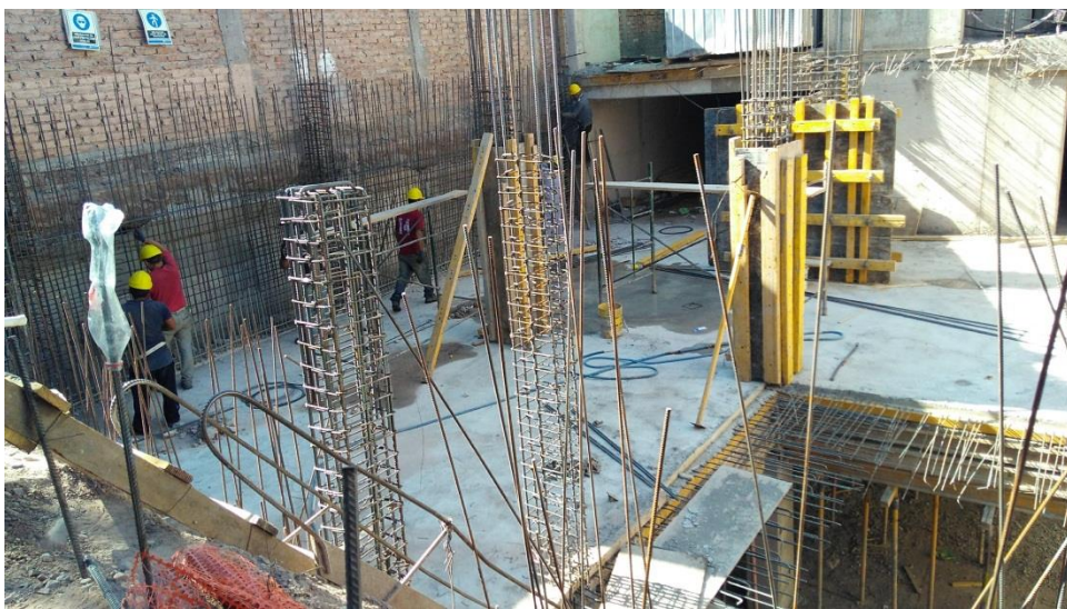
Imagen 9: Losa de primer subsuelo y arranque de columnas