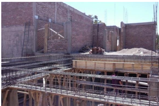
Imagen 19: Entramado de vigas.

Un aspecto interesante, fue la posibilidad de observar la ampliación de una vivienda, en la cual se utilizó un anclaje químico con epoxi, para vincular la construcción existente a la nueva. En la imagen 19 aprecia el entramado de vigas de la ampliación y el la imagen 20 se observan los detalles mencionados.