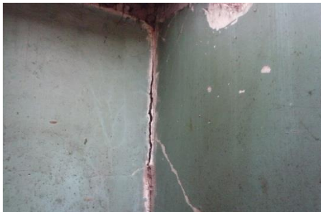
Imagen 1: Fisura en encuentro de muros

colindante. Sumado a esto, se presentaban problemas de humedad debido a filtraciones por el mal estado en que se encontraba el techo. En las siguientes imágenes se puede apreciar lo visto durante la inspección: