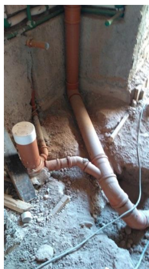
Imagen 28: Red interna de cloaca y prueba hidráulica