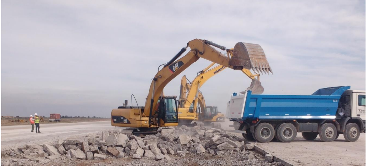
Imagen N° 3 : Retroexcavadoras cargando escombros a los camiones volcadores.