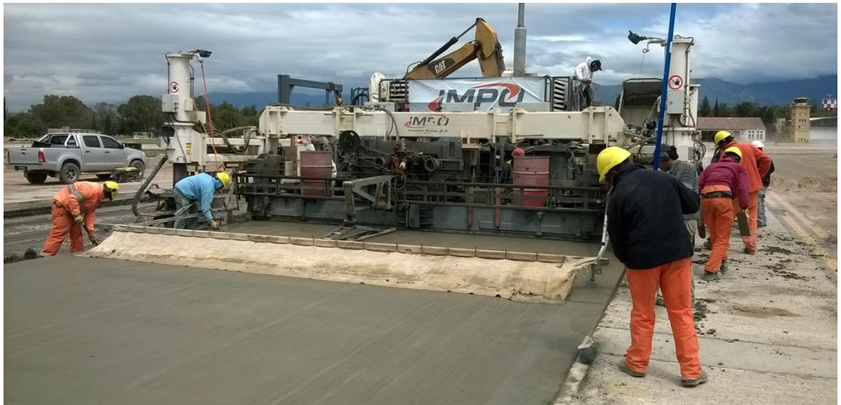
Imagen N° 22: Rodaje Bravo (se puede observar la diferencia de los anchos de la terminadora y el ancho de la losa a trabajar)