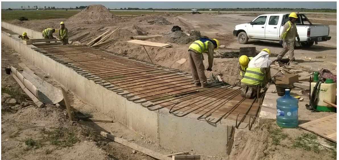
Imagen N° 35: encofrado y armadura de la tapa de la alcantarilla.