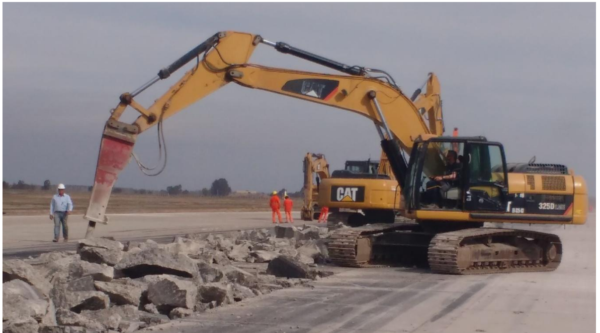
Imagen N° 2: Martillo neumático trabajando durante las tareas de demolición.

En la imagen N° 2, 3, 4, 5 y 6 se puede observar parte del procedimiento mencionado.