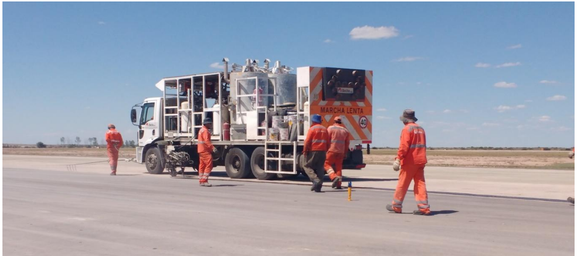
Imagen N° 33 : colocación de pintura negra.

En las imagen N°33 se puede observar parte del procedimiento descrito anteriormente.