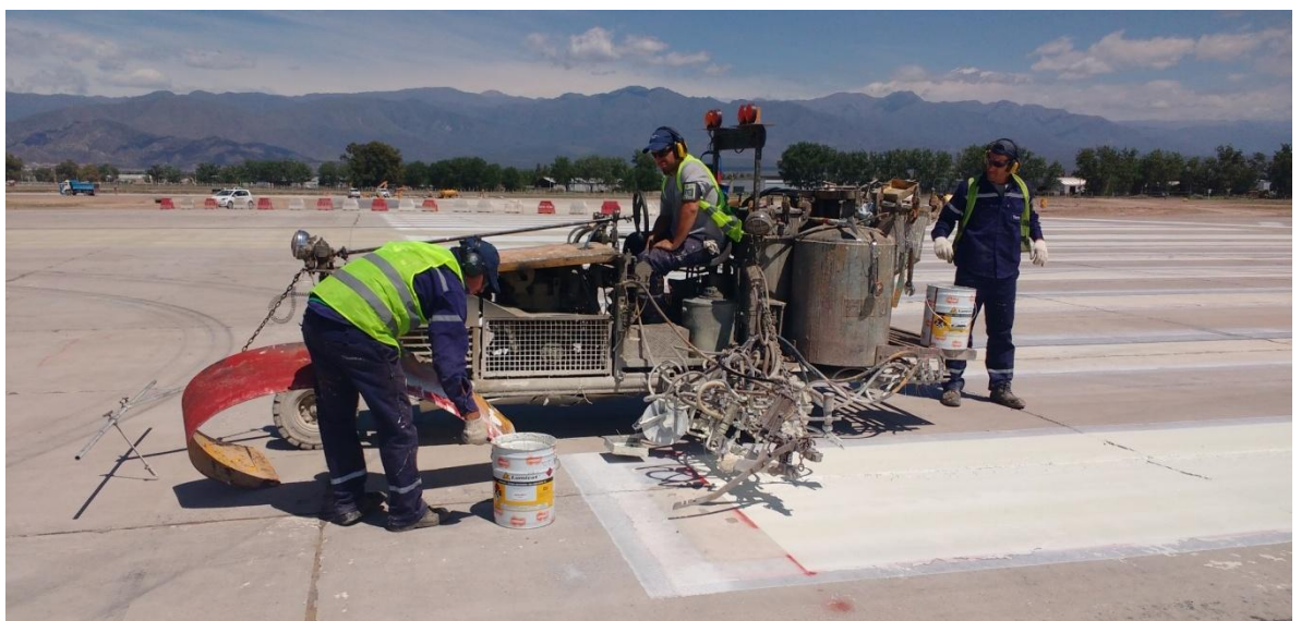
Imagen N°32 : Colocación de pintura blanca.