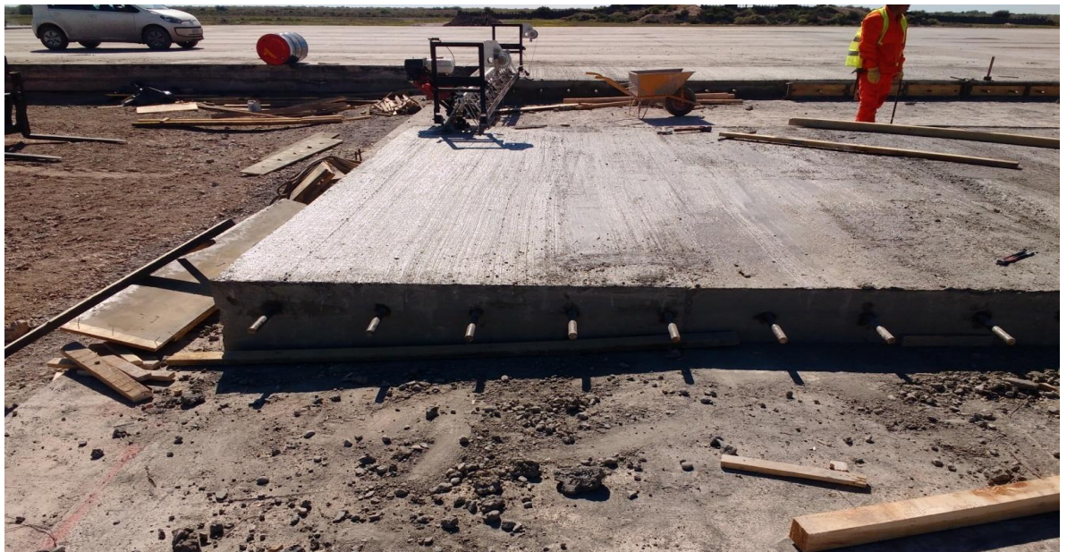
Imagen N° 24: Junta de construcción.