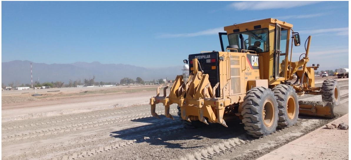
Imagen N° 8 : Distribución del cemento con motoniveladora