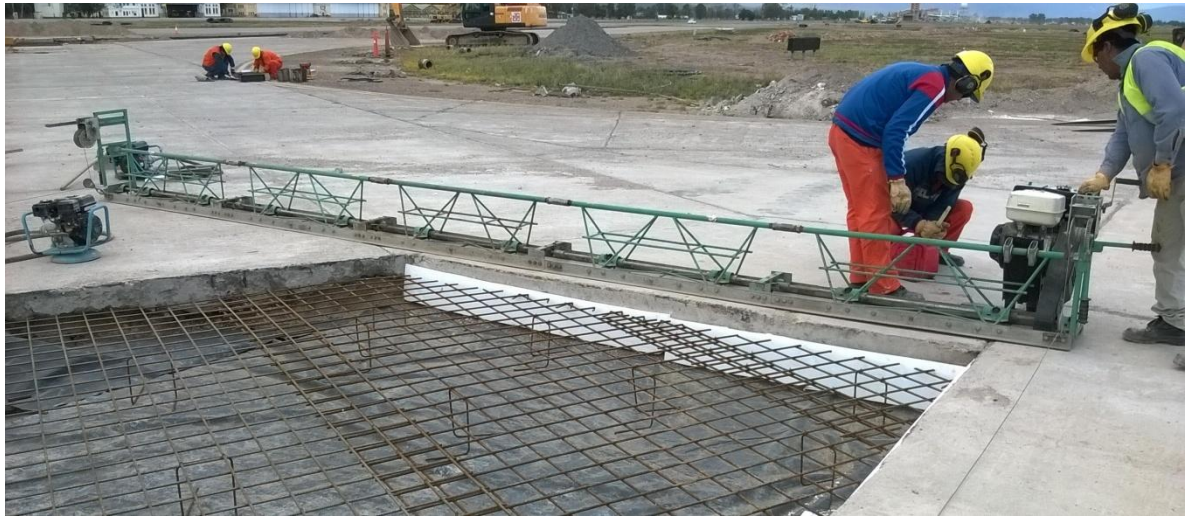
Imagen N° 25: Regla vibratoria y armadura de losa irregular.