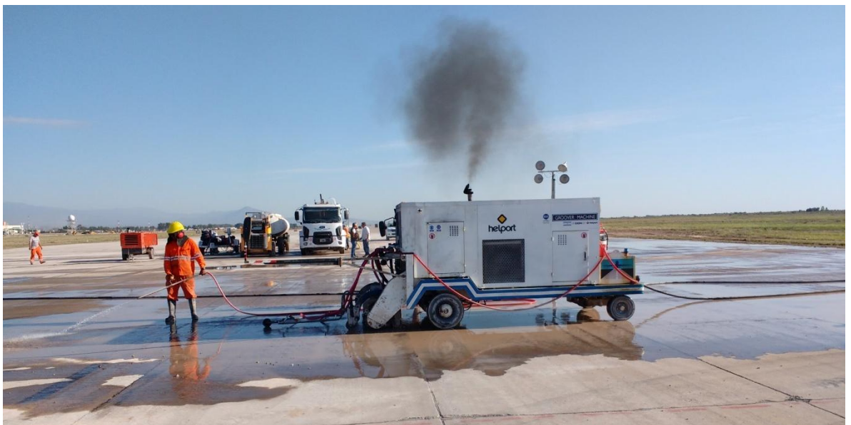
Imagen N° 13: ranuradora autopropulsada

En la imagen N° 13 y 14 se puede observar parte del procedimiento descrito.