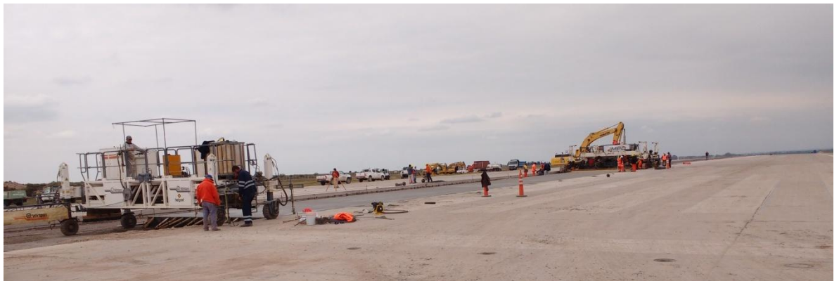
Imagen N° 11: Máquina terminadora y máquina de curado.