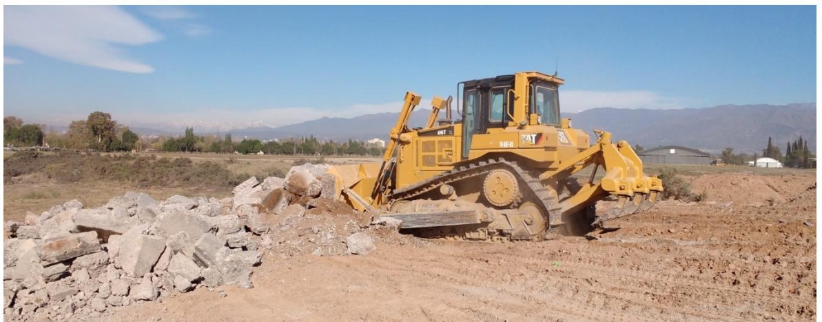
Imagen N° 6 : Topadora acomodando escombros en el sector sur de la pista.