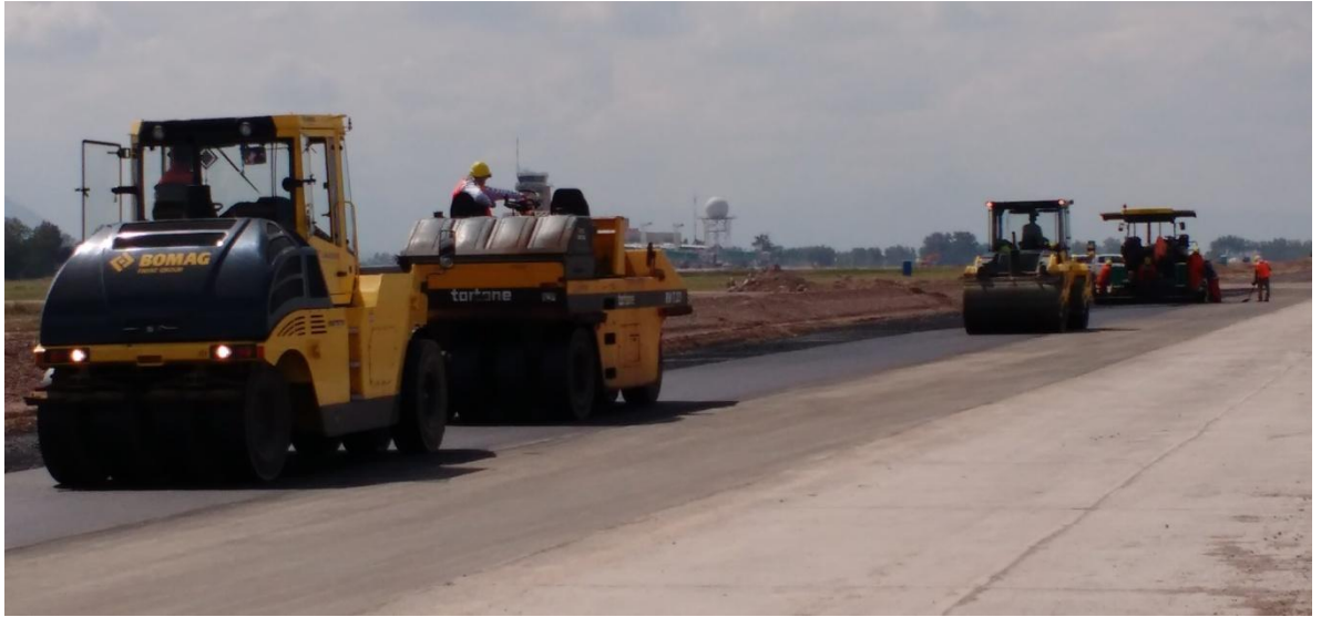
Imagen N° 30 : Rodillo liso y rodillos neumáticos para compactación.