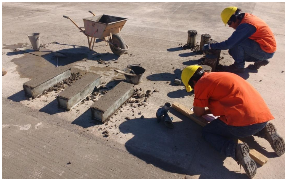
Imagen N° 3: Laboratoristas realizan las probetas que luego serán ensayadas

Los ensayos que pude observar en laboratorio son C.B.R (valor soporte relativo) para agregados, Estabilidad Marshall en concreto asfáltico, Compresión suelo cemento, Compresión simple y flexión de probetas de Hormigón. Además de estos ensayos de laboratorio, pude observar ensayos de Cono de arena para verificar densidad in situ , Cono de Abrams para verificar consistencia del hormigón , espesor de pintura para ver la calidad de la pintura refractiva utilizada para señalizar y temperatura de colocación de concreto asfáltico con termómetro infrarrojo. Claramente estos últimos ensayos se realizan en la zona de pista y rodaje. En las imágenes N° 3, 4, 5, 6 se puede observar parte de los ensayos mencionados.