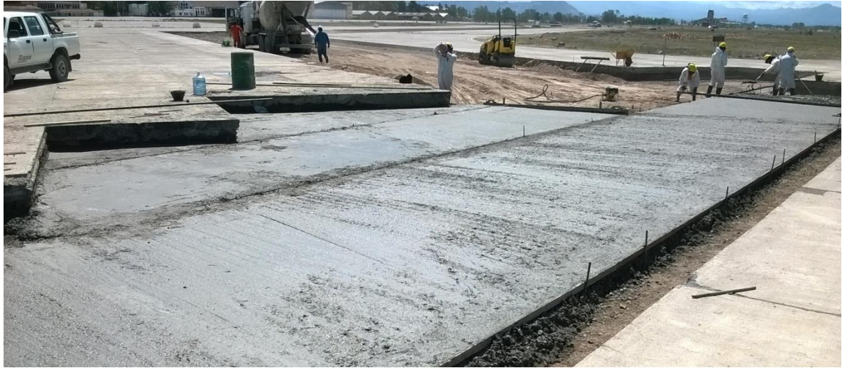
Imagen N° 20: Subbase de hormigón pobre.