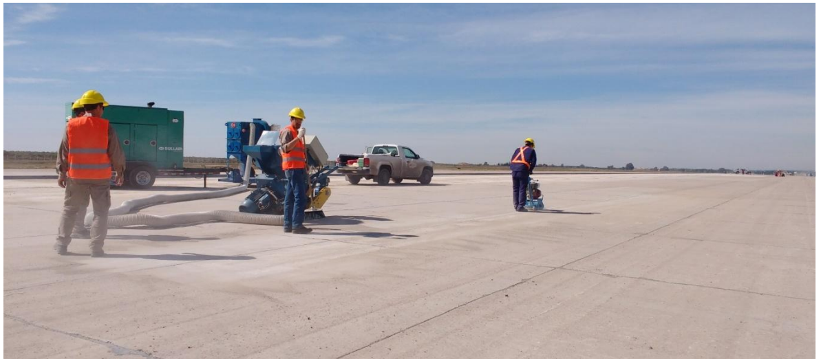
Imagen N°31 : Borrado mecánico de pintura de pista.

En las imágenes N° 31 y 32 se puede observar parte del procedimiento descrito anteriormente.