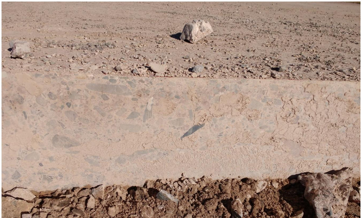
Imagen N° 16: Losa luego del aserrado.

En la imagen N° 16 se puede observar el estado final de la losa luego de finalizado el aserrado.