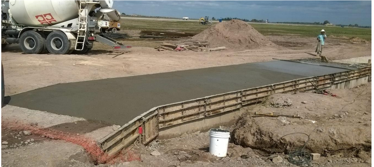
Imagen N° 36: hormigón recién colocado en la tapa de la alcantarilla.