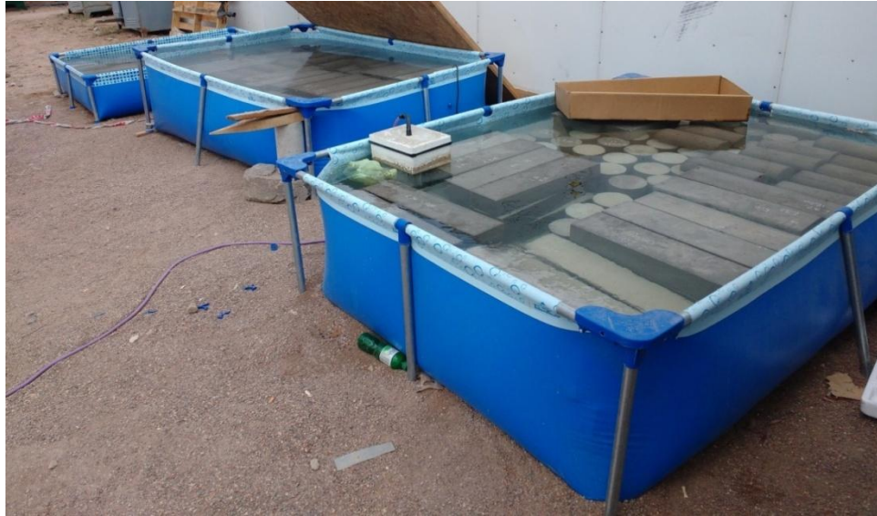
Imagen N° 4: Piletas de curado