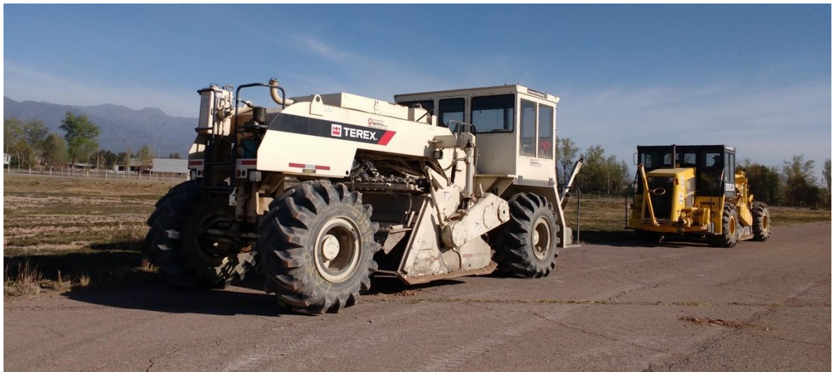
Imagen N° 7 : Reclamadoras

En la imagen N° 7, 8 y 9 se puede observar parte de la maquinaria mencionada.