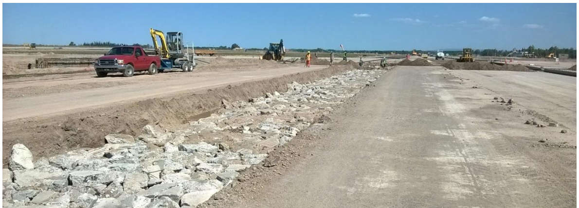
Imagen N° 27: Reemplazo de material existente por escombros de hormigón.

En la imagen N° 27 se puede observar parte de lo descrito anteriormente.