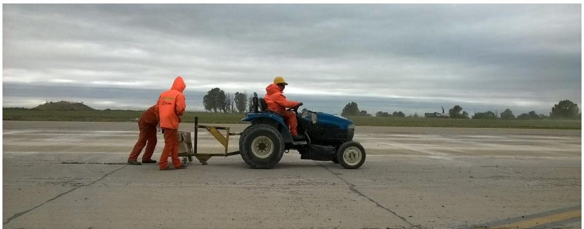
Imagen N°15 : tractor con complemento para extraer material.

En la imagen N° 15 se puede observar parte del procedimiento descripto.