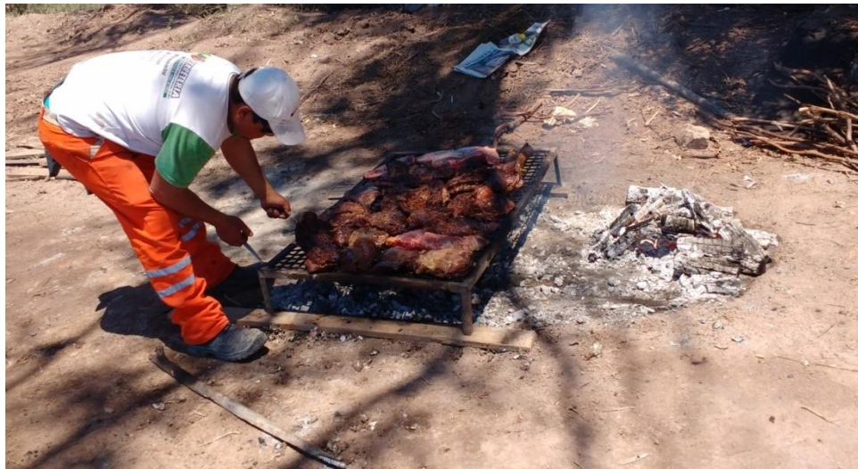
Imagen N° 7:Asado de obra

En la imagen N° 7 se puede observar uno de los asados de obra y en la imagen N°8 la cena de despedida que tuvimos con la empresa COAS S.R.L,