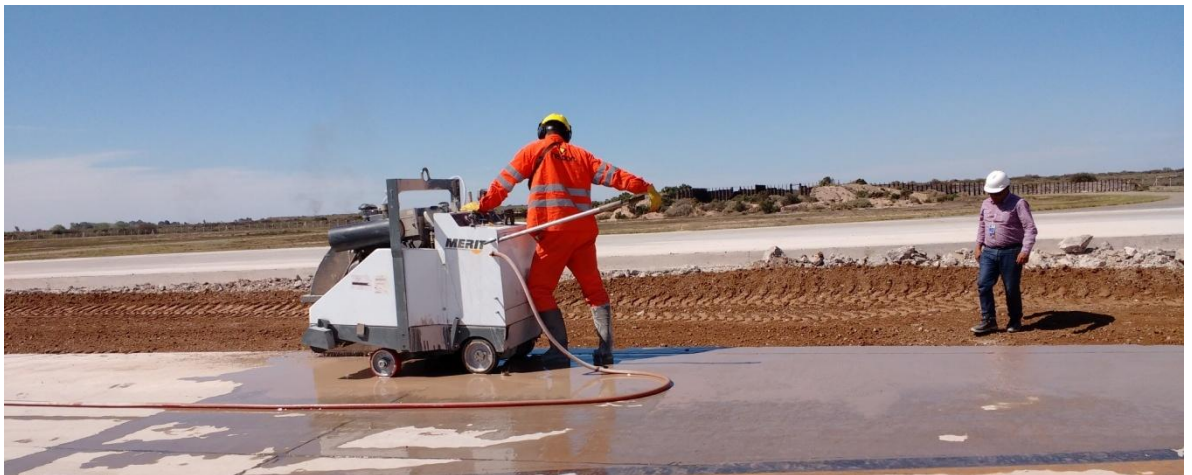
Imagen N° 4: Proceso de aserrado