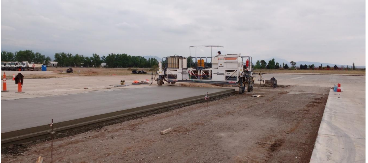
Imagen N° 12: Máquina terminadora. Se puede observar junta machihembrada.