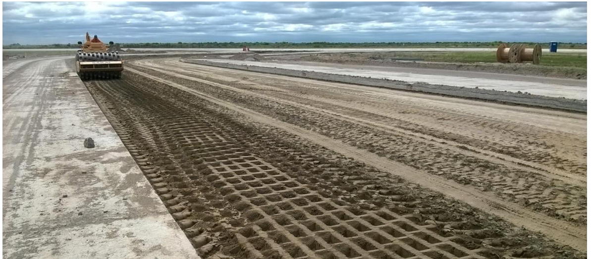
Imagen N° 18: rodillo para de cabra