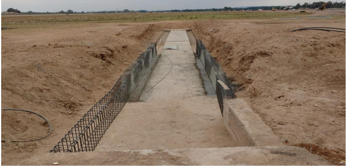
Imagen N° 34: Armadura de los tabiques.

En la imagen N° 34,35 y 36 se puede observar parte del procedimiento descrito anteriormente.