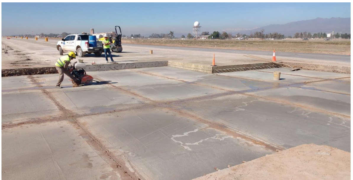
Imagen N° 19: aserrado de Subbase de hormigón pobre.

En la imagen N° 19 y 20 se puede observar parte de lo antes mencionado.