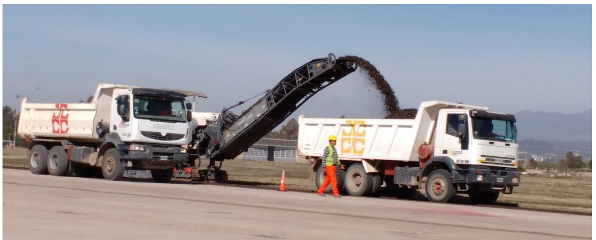
Imagen N° 26 : Equipo para fresado y dos camiones volquetes.

En la imagen N° 26 se puede observar parte de lo descrito anteriormente.