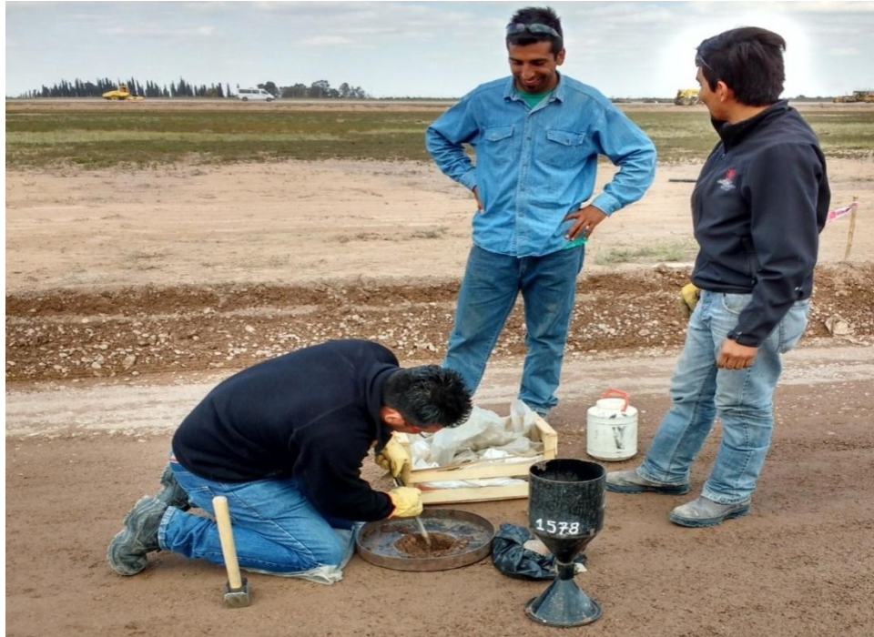
Imagen N° 6: Laboratoristas realizan ensayo cono de arena

Durante la realización de esta actividad, me sentí muy satisfecho ya que como alumnos, tenemos muy buena base debido a lo aprendido en materias como Tecnología del Hormigón, Mecánica de Suelos y Rocas y Carreteras. Otro punto importante fue que el grupo de laboratoristas era muy atento a nuestros pedidos y correcciones por parte de los estudiantes. Además nos enseñaron varias técnicas y consejos que facilitan el trabajo diario sin dejar de cumplir con la norma específica que regula ese ensayo.