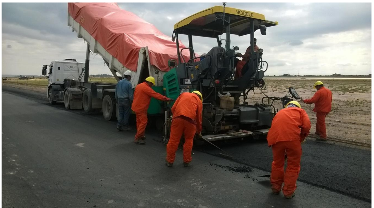
Imagen N°29: Camión volquete y terminadora

En la imagen N° 29 y 30 se puede observar parte del procedimiento descrito anteriormente.