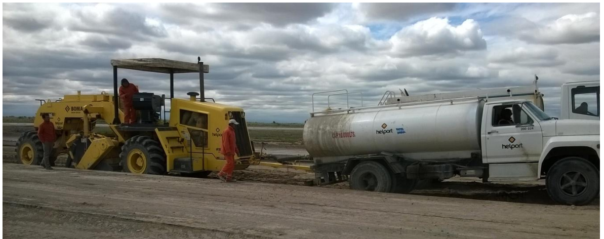
Imagen N° 17 : equipo reclamador y camión cisterna.

En la imagen N° 17 y 18 se puede observar parte del procedimiento mencionado.