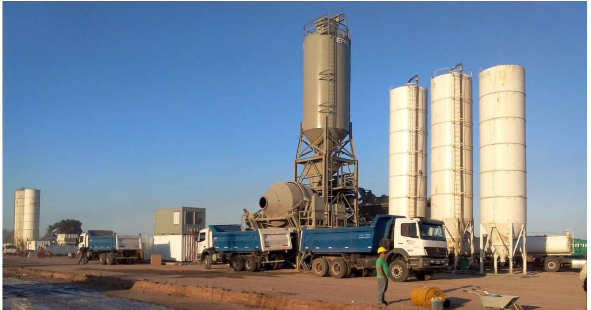
Imagen N° 10: Planta elaboradora de Hormigón.

En la imagen N° 10, 11 y 12 se puede observar parte del procedimiento antes mencionado.