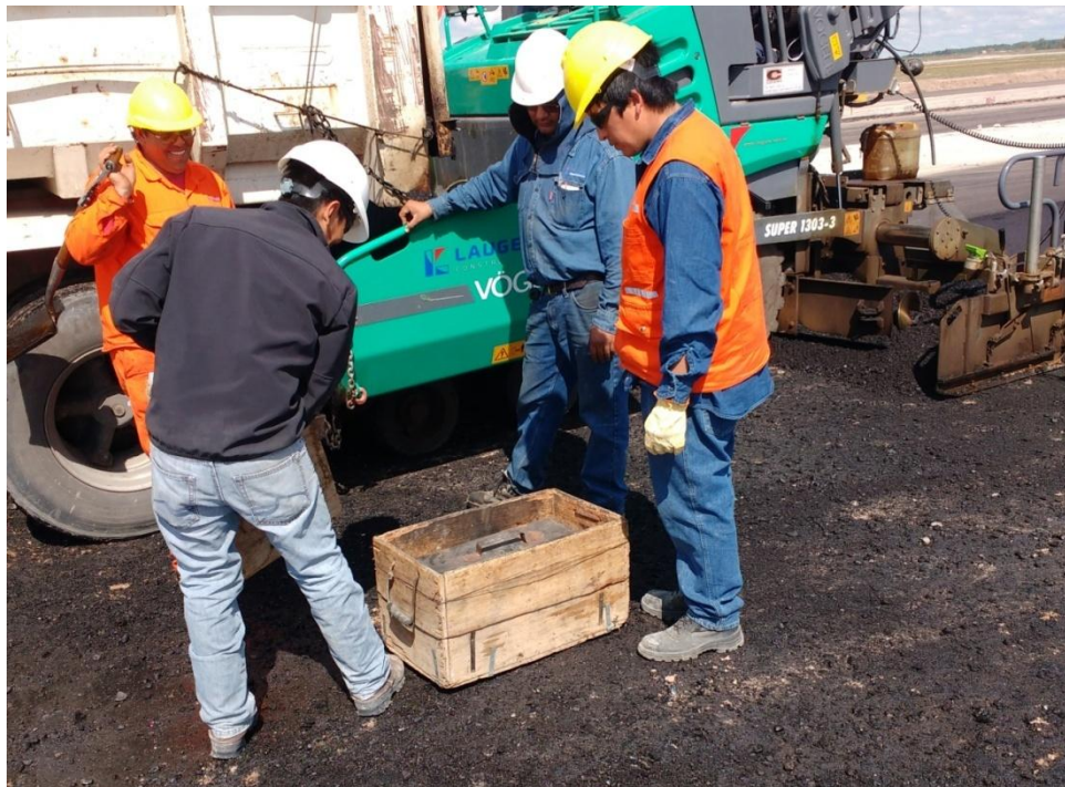
Imagen N° 5: Laboratoristas toman muestras de concreto asfáltico