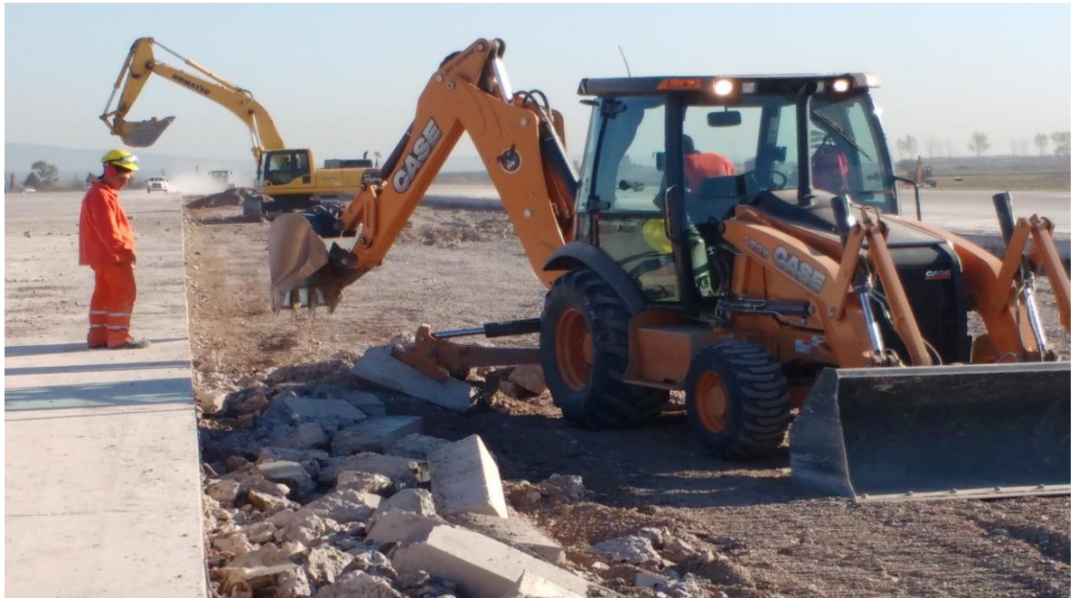
Imagen N° 5: Retroexcavadoras retirando escalón de H° producto del proceso mencionado.