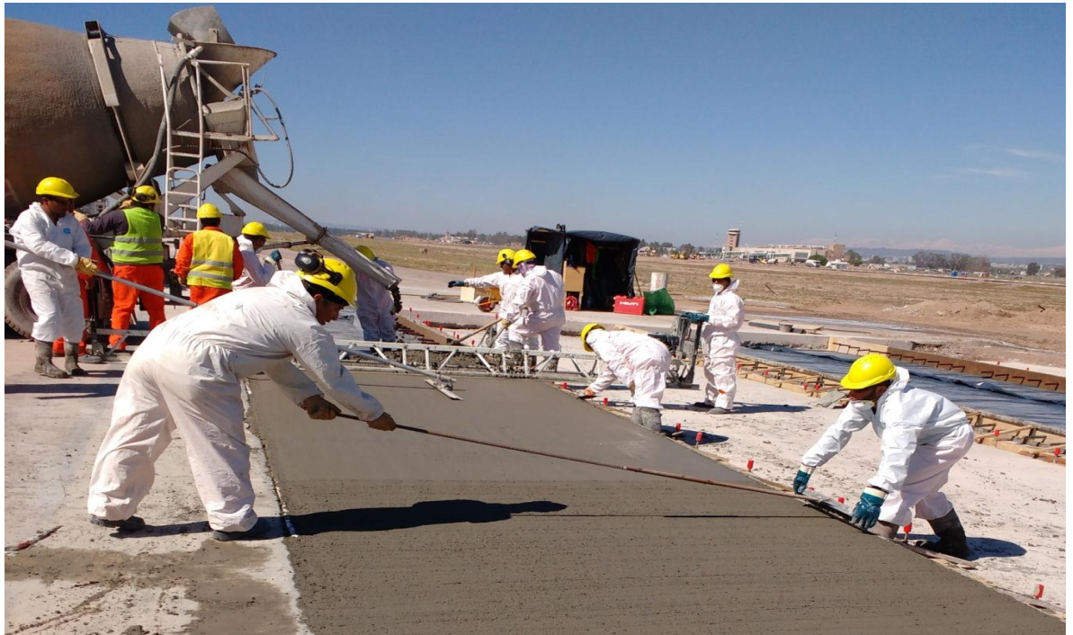
Imagen N° 23 : Camión mixer , fratachos y cepillo para terminación final.

En la imagen N° 23,24 y 25 se puede observar parte de lo descrito anteriormente.