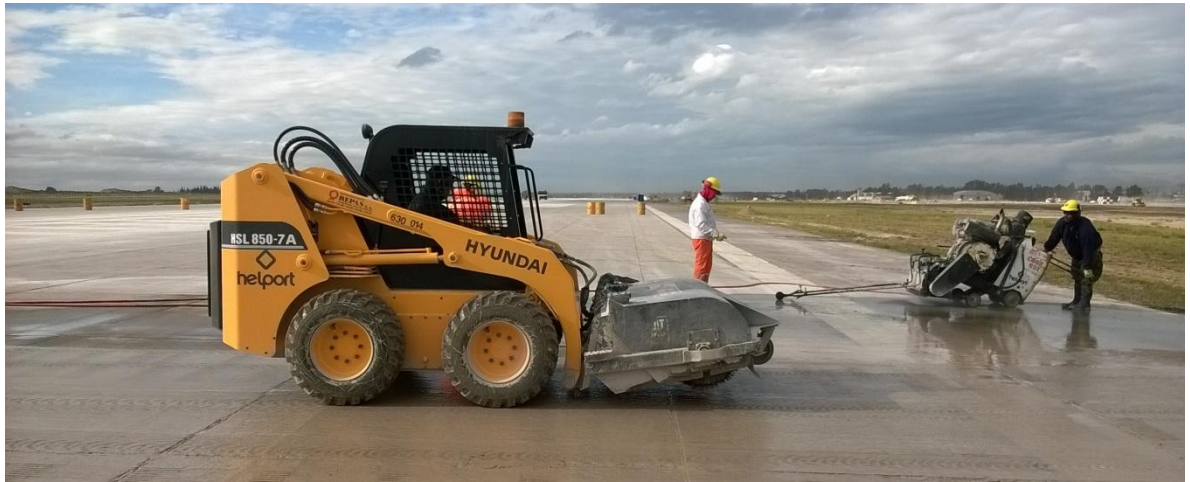
Imagen N° 14: Máquina con cepillo para evacuar agua y ranuradora manual.