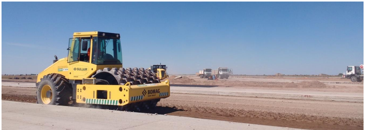
Imagen N° 9 : Compactación de suelo cemento con rodillo pata de cabra.