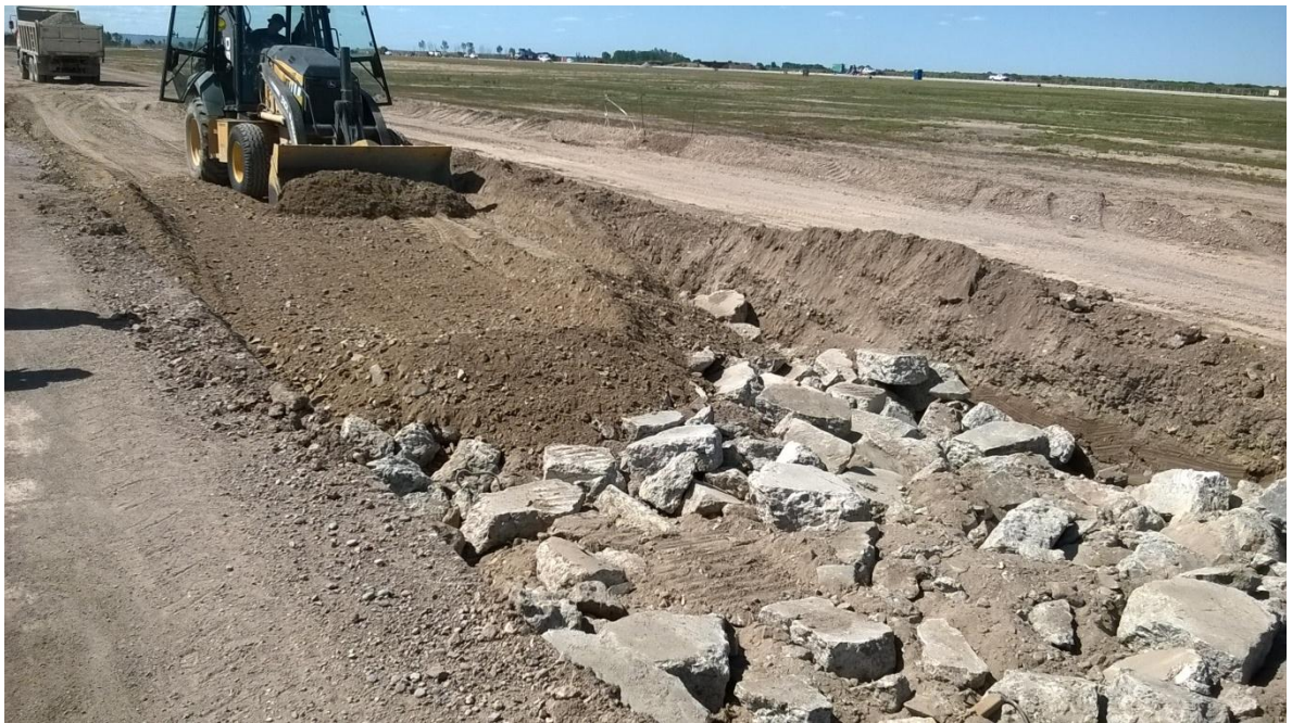
Imagen N°28 : Colocación de sub base granular sobre reemplazo de material debido a bacheo.

En la imagen N° 28 se puede observar parte del procedimiento descrito anteriormente.