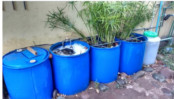
FOTOGRAFIA 1: Planta de tratamiento en régimen normal de funcionamiento

Las especies vegetales plantadas mostraron un comportamiento disímil. La especie Cyperus sp emitió brotes y aumentó rápidamente la masa vegetal. El sistema radicular de esta especie también presentó un notable desarrollo (Fotografía 1)